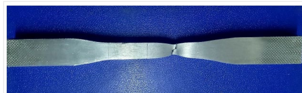
Figura 39. Probeta luego de la rotura